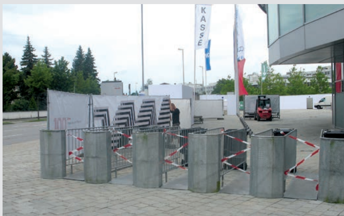
Varchi d'accesso FORIS ad un evento nel settore industriale