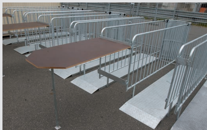
Varchi d'accesso con banchi per l'ispezione delle borse