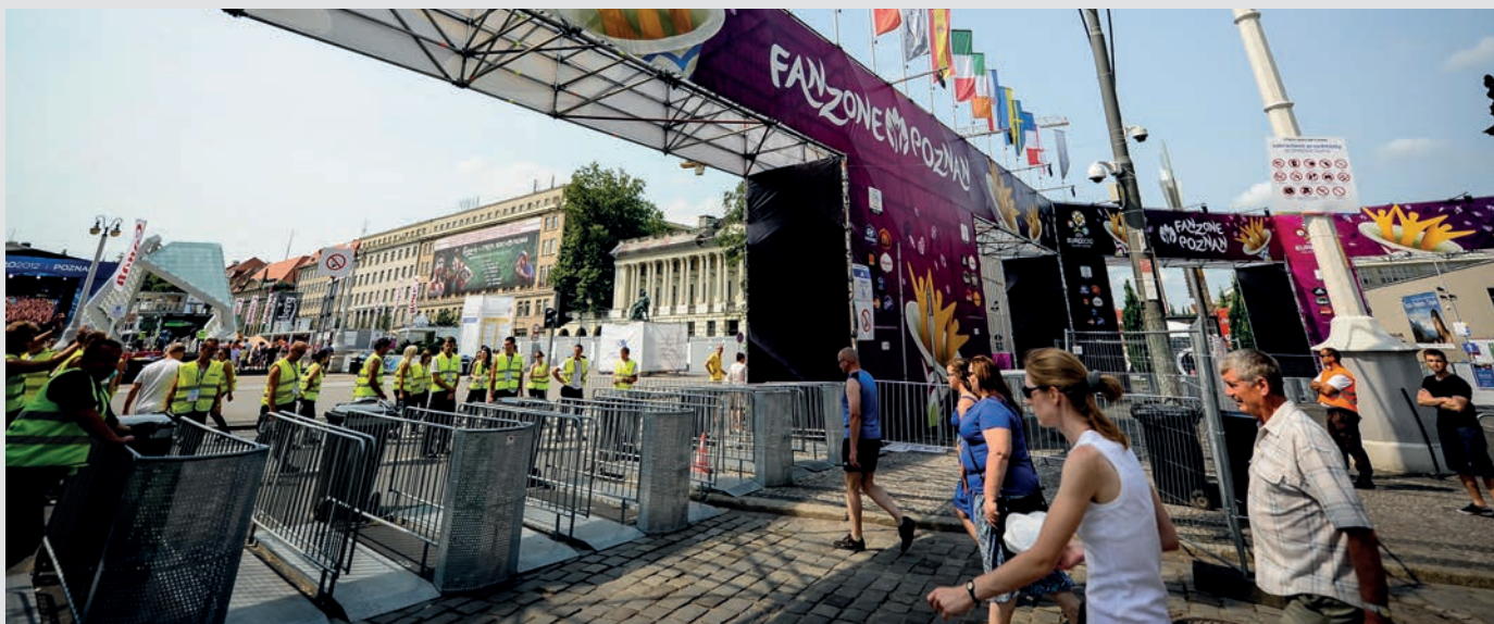
Controllo dei visitatori nell'area di ingresso, UEFA Euro 2012, Poznan