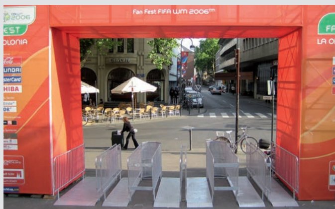
Varchi d'accesso FORIS, Public Viewing, Campionati mondiali FIFA 2006