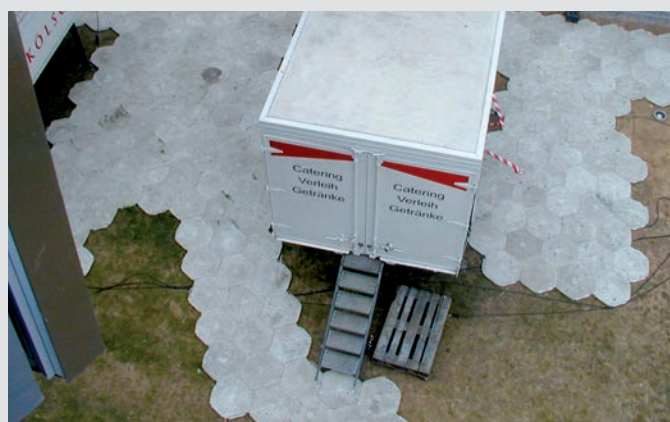
Różne możliwości układania