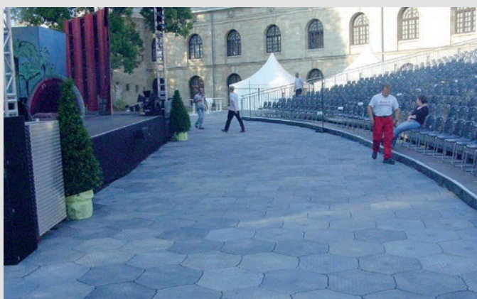
System ochrony podłoża w strefie dla publiczności