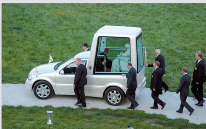
Hexagon jako droga dojazdowa Światowy Dzień Młodzieży 2005 Marienfeld, Kolonia