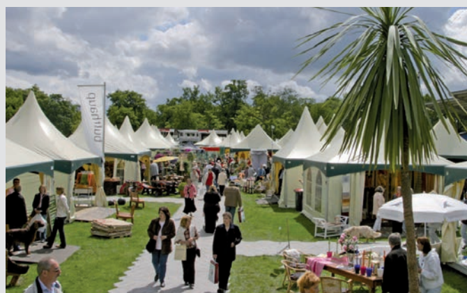
Hexagon jako droga dla pieszych, targi Home & Garden